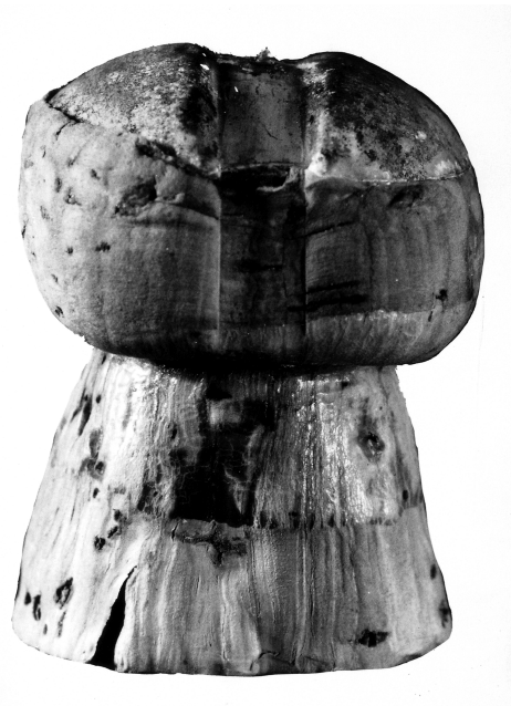
Abb. 1 Anton Stankowski, Korken , um 1935.

Was wir nicht sehen, bleibt unseren assoziativen Fähigkeiten überlassen. So werden uns nicht nur Informationen über den Darstellungskontext vorenthalten, sondern auch Hinweise auf die reale Größe und