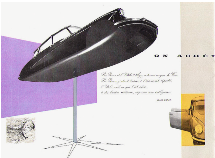
Abb. 13 Produkt-Broschüre, 1959

getilgt war. Zweitens war die gut sichtbare Unterseite der Karosserie durch eine Verschalung komplett verschlossen. (Abb. 11). Mit dieser sichtbaren Beseitigung der für die Fortbewegung notwendigen Funktionsteile sowie der Ausblendung der technischen Innereien manifestiert sich die erneuerte Form als Transportmittel für Sinnhaftigkeit.