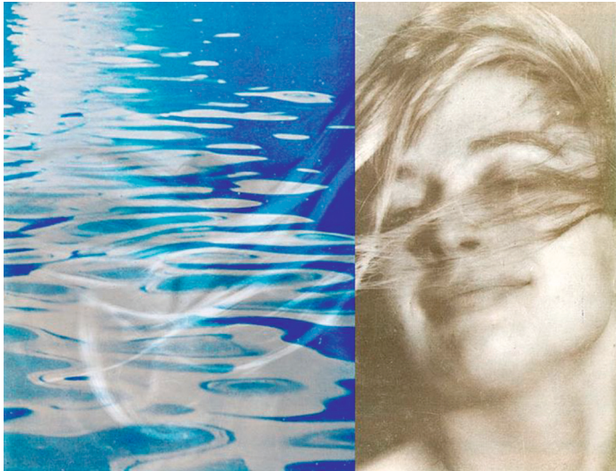
Abb. 14 Produkt-Broschüre, 1958