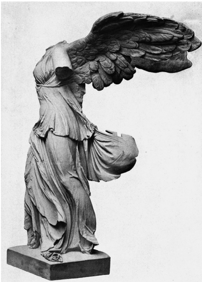
Abb. 16 Nike von Samothrake, um 190 v. Chr.

imaginären wie affektiven Sinne dar, denn ehemals überweltliche Verhältnisse erscheinen im technischen Zeitalter mit einem Mal als realisierbar. In den 1950er-Jahren findet die auf Permanenz gestellte Aufbruchstimmung der Moderne ihr zeitgemäßes Bild in Gestalt der DS-Ikonografie. Entsprechend wird das Antlitz der jungen Frau auf dem Broschüren-Cover, auf dem sich die wellende Bewegtheit des Haars und des Wassers, die Vorstellungsbilder der geschwungenen Silhouette der DS und des Dahinfliegens überlagern, zum zeitgeisterfüllten Emblem: Gewichtslosigkeit («weightlessness») als Zeichen einer grandiosen Seinsleichtigkeit.