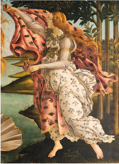
Abb. 15 Sandro Botticelli: Die Geburt der Venus, 1485/86 (Detail)