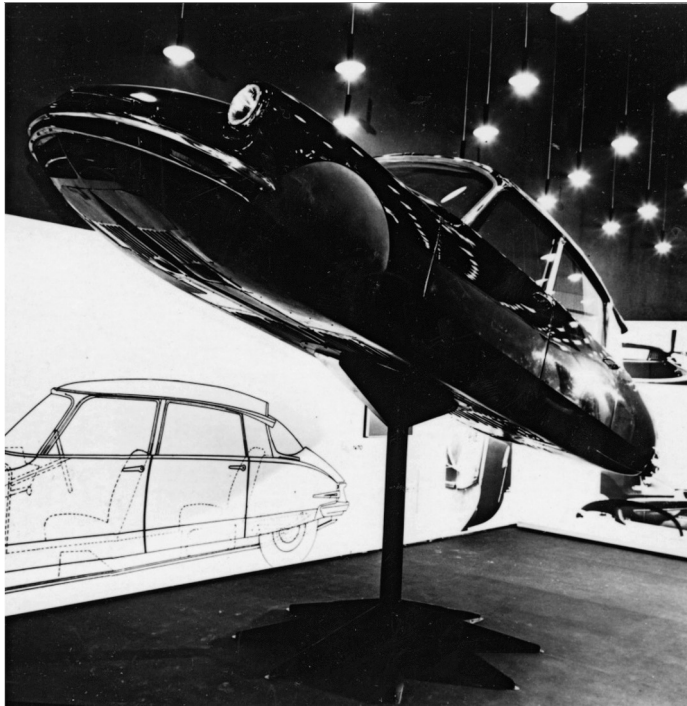
Abb. 11 Triennale di Milano, 1957