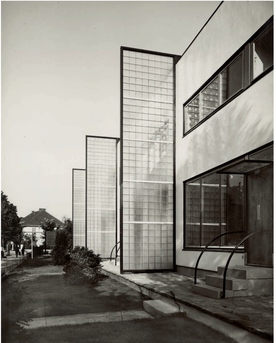
Reihenhäuser Schorlemerallee 12–12c, 1929/30