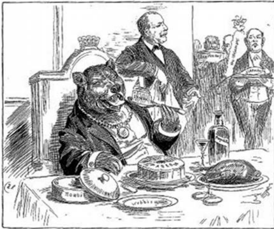
Groß-Berlins Bürgermeister Adolf Wermuth deckt dem Berliner Bären die Tafel mit den ehemals selbstständigen Vorortgemeinden, Karikatur auf die Schaffung Groß-Berlins vor 100 Jahren, Heimatverein Steglitz e.V., aus: Steglitzer Heimat, 36. Jg. 1991, Nr. 1, Titelseite

alle Bedenken beiseite gefegt. Der Architekt Albert Gut brachte es auf den Punkt: Die Wohnungsnot, schrieb er, war „eine grausame, harte und unerbittliche Lehrmeisterin, die [...] in Wochen, ja in Tagen und Stunden Dinge möglich machte, die vor dem Krieg in Jahren und Jahrzehnten nicht zu erreichen gewesen wären.“ 4