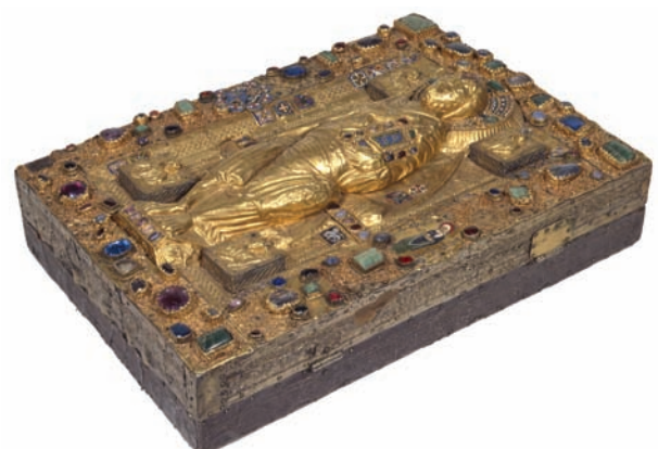
Buchkasten des Uta-Codex, um 1020/30, München

David Ganz, Professor für Kunstgeschichte des Mittelalters an der Universität Zürich; Buchpublikationen zur Geschichte der Visionsdarstellung, zu Bilderräumen der frühen Neuzeit, zu mehrteiligen Bildanordnungen und zu Fragen des peripatetischen Sehens.