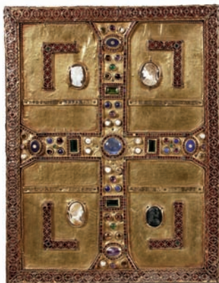
Evangeliareinband der Theodelinda, Rückdeckel, um 600, Monza

Elfenbein – Gold – Seidenstoffe: Hüllen aus kostbaren Materialien verwandeln die Bücher des christlichen Kults in skulpturale Objekte. Mit seiner Studie zum mittelalterlichen Prachteinband erschließt David Ganz ein zentrales Kapitel westlicher Kunstgeschichte. Über das Medium Einband öffnet sich ein neuer Blick auf die enge Verbindung von Buch und Kunst.