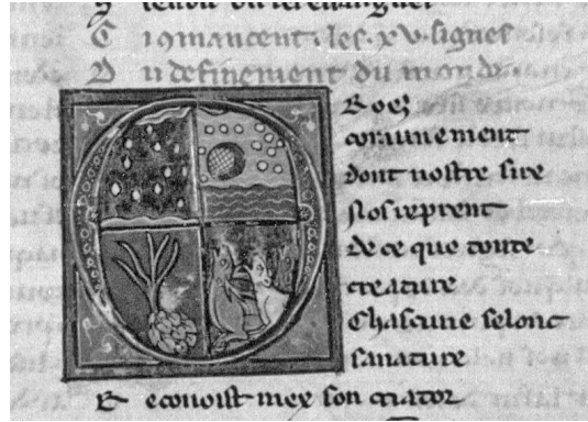
Abb. 2 O-Initiale. Ms. français 1533, Paris, fol. 33r

bornschen Bibliothek in Pommersfelden datiert; sie entstammt der Oberpfalz. Der Text folgt der sogenannten altfranzösischen (oder anglo-normannischen) Version der Fünfzehn Zeichen (Abb. 1). In jenen Jahren, genauer gesagt 1344/45, malte auch der als Orcagna bekannte Andrea di Cione ein Fresko an die südliche Wand des Seitenschiffs von Santa Croce in Florenz. Das Hauptbild zeigte den Triumph des Todes, das Jüngste Gericht und die Hölle, umgeben war diese heute weitgehend zerstörte Trias von einem Schmuckrahmen mit Medaillons – in letzteren waren die Fünfzehn Zeichen dargestellt (Farbabb. 2). Wohl 1390 entstand in Nürnberg ein von der Familie Rieter gestiftetes Glasfenster. Sein Motiv ist von einem Schriftband umgeben, welches besagt, dass hier die Fünfzehn Zeichen vor dem Jüngsten Gericht zu sehen sind (Farbabb. 3). Die älteste bekannte Darstellung hingegen ist nur ein Ausschnitt aus der Reihe der Zeichen. Es handelt sich dabei um die Illustration in einer Initiale einer französischen, um 1276–1287 entstandenen Handschrift. In einem in Viertel unterteilten \text{O} sind vier Zeichen zu sehen (Abb. 2).