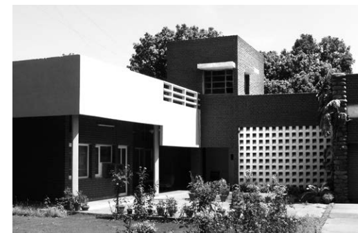
Sektor 10 _ Privathaus (ca. 1960)

nach einem gleichförmigen Muster konzipierten Wohnviertel. In regelmäßigen Abständen reihten sich die Eingänge der Häuserreihen aneinander. Markante, rechtwinklige Mauervorsprünge zierten die Fassaden und nur gelegentlich war ein Dekor zu entdecken. Unweigerlich weckte die Zeilenbauweise mit Flachdächern Assoziationen zum »Neuen Bauen« der 1920er Jahre in Europa. Wären nicht mit Saris gekleidete Damen und Gemüsehändler auf Rikscha-Lastenrädern unterwegs gewesen, hätte ich mir einbilden können, meine heimatlichen Gefilde gar nicht verlassen zu haben. Denn die Parallele zum Erscheinungsbild der Gartenstadt-Siedlungen meines damaligen Wohnsitzes Frankfurt am Main, die Stadtbaurat Ernst May zwischen 1925 und 1930 konzipierte, oder zum Design von Architekten aus dem Umfeld des Bauhauses war frappierend. 3