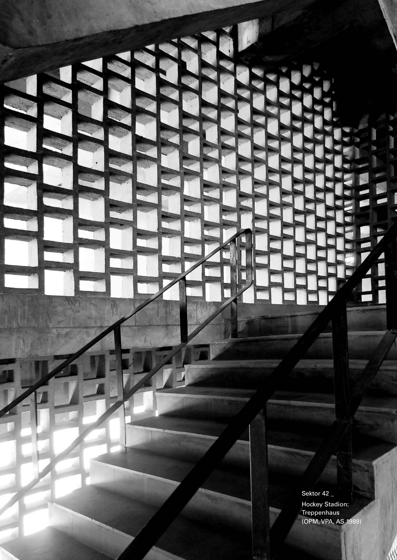
Sektor 42 _ Hockey Stadion: Treppenhaus (OPM, VPA, AS 1989)