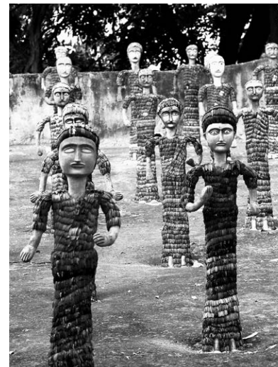
Sektor 1 – Rock Garden: Figuren von Nek Chand

Mehr als ein halbes Jahrhundert nach Baubeginn haben die lokalen Bezüge der Benennung kaum noch Bedeutung. In der mittlerweile von über einer Million Menschen bewohnten Stadt errichteten die Bewohner und Bewoh-