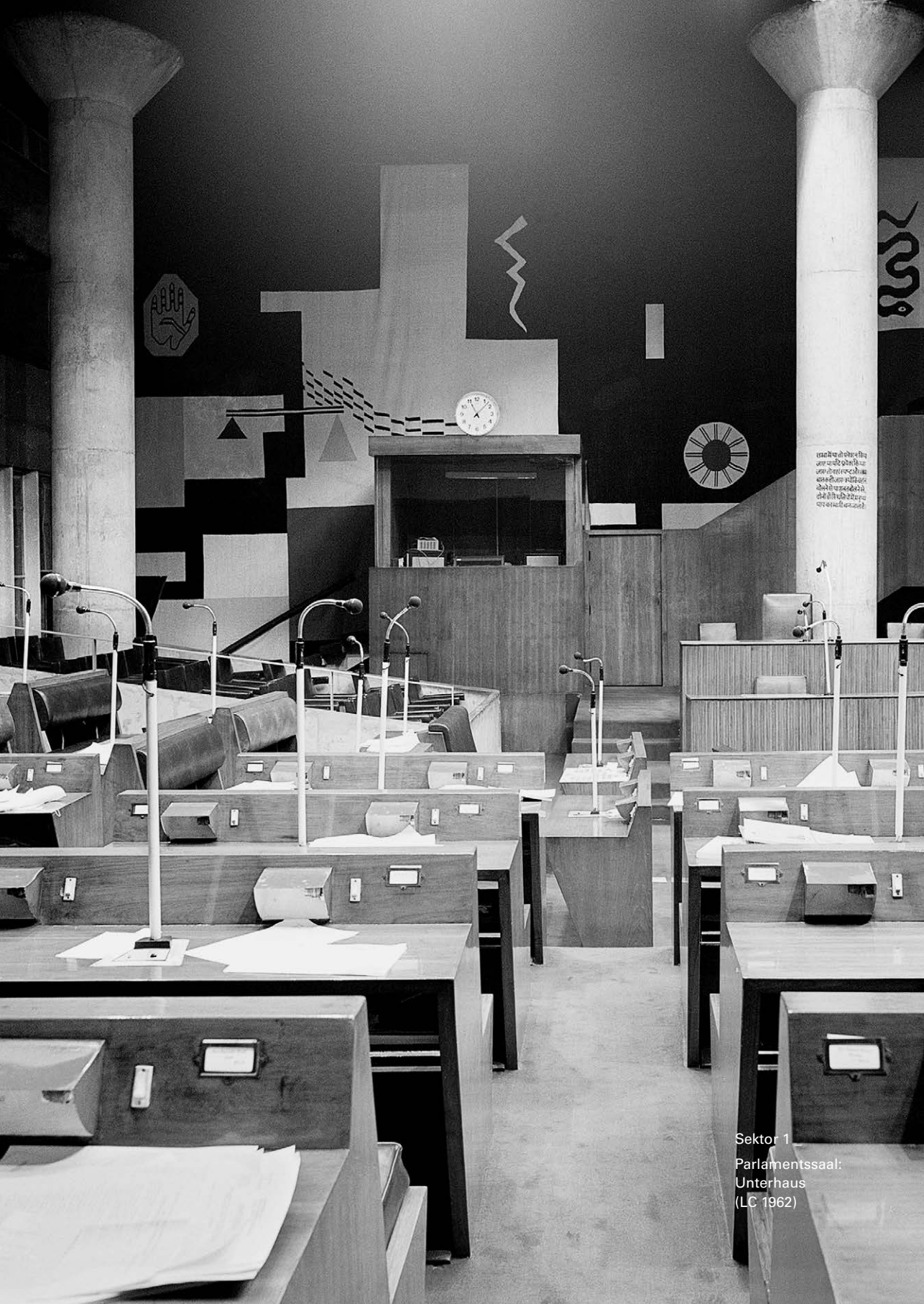
Sektor 1 Parlamentssaal: Unterhaus (LC 1962)