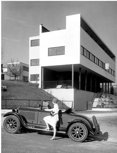
Stuttgart _ Haus von Pierre Jeanneret und Le Corbusier (1927); Werbeaufnahme von Mercedes-Benz