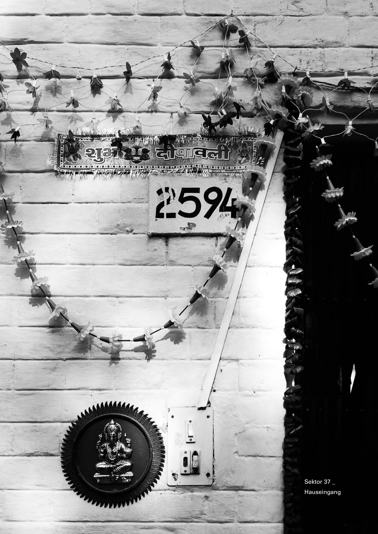
Sektor 37 _ Hauseingang