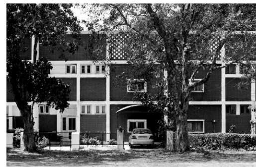
Sektor 18 _ Wohnungsbau in Zeilenbauweise (EMF, ca. 1954)

Gegenüber des zentral gelegenen Busbahnhofs nahm ich ein Zimmer in einem kleinen Hotel. Das Fenster bot Aussicht auf eines der von Le Corbusier