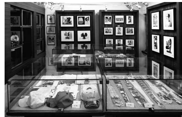
Sektor 19 _ Le Corbusier Centre: Souvenir-Shop

Das vierte Kapitel thematisiert am Ende ambivalente Aspekte der Modellstadt, deren städtebauliche Figur einst »modernness« versprach. Unter den Schattenseiten der City Beautiful spreche ich zunächst das ausgesprochen unausgewogene Geschlechterverhältnis (die sogenannte »sex ratio«) an, bevor ich auf die Existenz von Slums eingehe. Diese stellen seit Jahrzehnten den großen Makel dar, da sie nicht mit der ursprünglichen Ideologie der perfekt geplanten, sozialen Stadt kompatibel sind. Inwieweit der »heilige« Masterplan soziale Segregation bedingt, wird später in Kapitel 6 vertieft. Zum Abschluss des ethnografischen Teils skizziere ich meine Eindrücke von kleinstädtischer Atmosphäre in der mit großer Geste entworfenen Stadt.