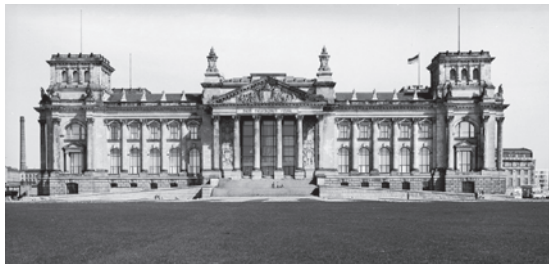
Reichstagsgebäude nach der Sanierung 1957–61

wilhelminische Pracht und Schwere schuf er im entkernten Inneren einen lichtdurchfluteten, vom Vestibül hinter dem Portikus durch eine gewaltige Glaswand abgetrennten Mehrzwecksaal mit umlaufenden Emporen, der durch seine noble Sachlichkeit und Eleganz überzeugte. Ähnlich wie der Deutsche Pavillon auf der Brüsseler Weltausstellung von Egon Eiermann und Sep Ruf (1958) repräsentierten Baumgartens Raumfolgen eine zurückhaltende, den demokratischen Werten von politischer Transparenz, westlicher Kultur, technischer Effizienz und optimistischer Fortschrittsgläubigkeit verpflichtete Bundesrepublik. Zu dieser Ausstrahlung trug auch die im Vestibül aufgehängte abstrakte Aluminiumplastik „Kosmos“ von Bernhard Heiliger bei, deren dynamische Formen laut Wolfgang Thierse Assoziationen von Freiheit und Dynamik auslösten.