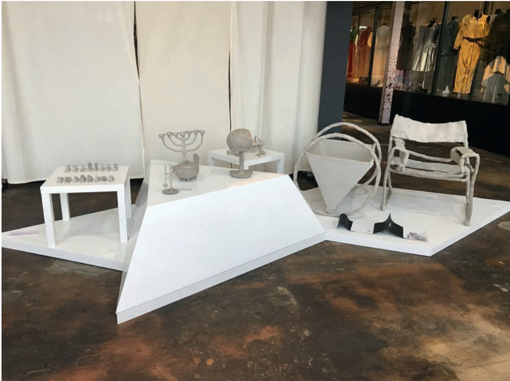
Abb. 2 Acht Bauhaus-Ikonen aus Pappmaschee und Draht von Leonie Schlüter, FHS Dortmund, Blick in die Ausstellung „Zukunft jetzt!“ als Teil des „Bildungskonvents“, LWL-Industriemuseum, TextilWerk Bocholt, März 2020

NRW-Verbundes im örtlichen Bauhaus-Center Revue passieren ließen, kam die Idee auf, die thematisch in Zeiten und Räume zerstreuten Rezeptionsgeschichten noch stärker im Kontext diverser Angelegenheiten diverser Staaten zu befragen. Das Bauhaus-Bild, das in Israel in der Spanne von Forschung über Tourismus bis Staatsideologie gepflegt wird und worüber Milena Karabaic am Ende dieses Bandes mit Blick auf die weißübertünchten Hintergründe schreibt, ist schon für sich widersprüchlich und problembeladen. Ein rein innerdeutscher Rückblick erschien umso enger, geradezu partikulär.